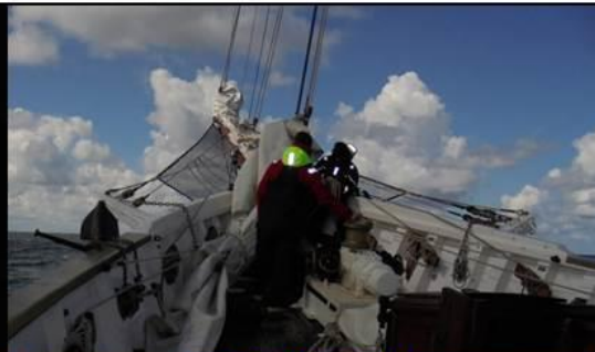
Belle Poule – Baltique 2017