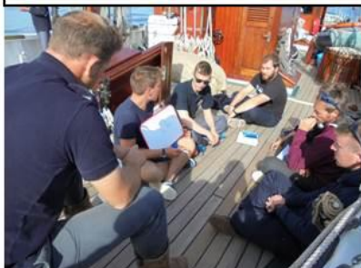
Cours théoriques avec les élèves Ecole navale et marine marchande

Après avoir traversé à la voile cette nuit une zone légèrement dépressionnaire avec des pluies importantes, la Belle Poule navigue actuellement dans une zone anticyclonique sans vent au moteur. Le temps va se dégrader dans les prochaines 24 heures avec l'arrivée d'une nouvelle perturbation orageuse avec des pluies soutenues.