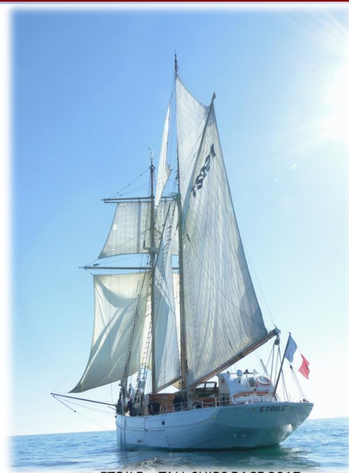
ETOILE - TALL SHIPS RACE 2017-

La Fortune : La fortune est une grande voile ballon qui se grée à l'aide de tangons sur babord et tribord. Elle se porte vent arrière ou grand largue et pourrait être assimilée au Spinnaker des voiliers de plaisance.