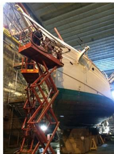
Belle Poule – ATM 2016 - 2017