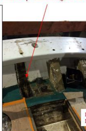
Présence de pourriture allonge de voute

La reprise d'échouage a été effectuée avec brio par le chantier du GUIP (gite nulle BPL accorée au MM). La dépose des plaques de cuivre sur le galbord a permis de constater que le bordage est sain (pas de présence de pourriture). Présence de pourriture observée (connue avant ATM) sur les massifs entre l'étambot et le contre étambot et sur une tête d'allonge de voute (voir photos).