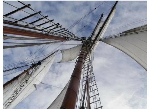
La Belle Poule est toutes voiles dehors

Nous avons donc rejoint la capitale de la province de l'Ulster pour deux jours. Les vents subis à quai ainsi que la pluie incessante n'ont d'ailleurs nourri aucun regret dans les rangs de l'équipage.