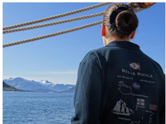
La goélette s'éloigne des fjords norvégiens.

Cet archipel, possession danoise, sera notre prochaine relâche sur la route de l'Islande.