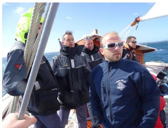
Les chefs du quart et le commandant retrouvent leurs repères.

En effet, si les premiers jours furent conduits sous un soleil de plomb et une légère brise, les suivants laissèrent la place à un vent fort et « rafaleux ».