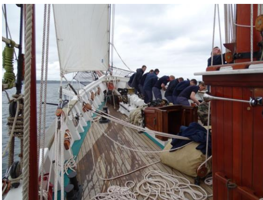
Aujourd'hui on sort les voiles...

Une météo hivernale propice à la prise en main de la goélette par l'équipage et les passagers. La montée en gamme se poursuivra durant le transit vers Belfast où nous devons être prêts pour courir la Tall Ship's Race.