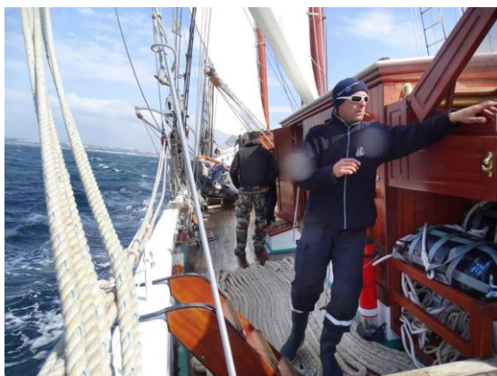
35 nœuds en rade pour la sortie au profit des réservistes.

Les premiers marins recrutés pour la mission d'été sont déjà arrivés et ont pu sortir à la mer avec la goélette. Leurs yeux pétillants nous réjouissent déjà et démontrent leur appétit de découverte. Mais ils devront patienter encore un peu avant de prendre le large car l'heure est aux permissions.