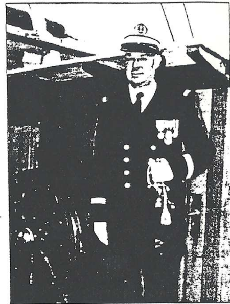
Le capitaine de vaisseau Michel Audren, commandant de l'« Étoile ».

mentation Thétis , puis de prendre la conduite du navire océanographique D'Entrecasteaux . Nommé lieutenant de vaisseau le 1 er août 1997, il est depuis le 1 er septembre commandant de l'« Étoile ».