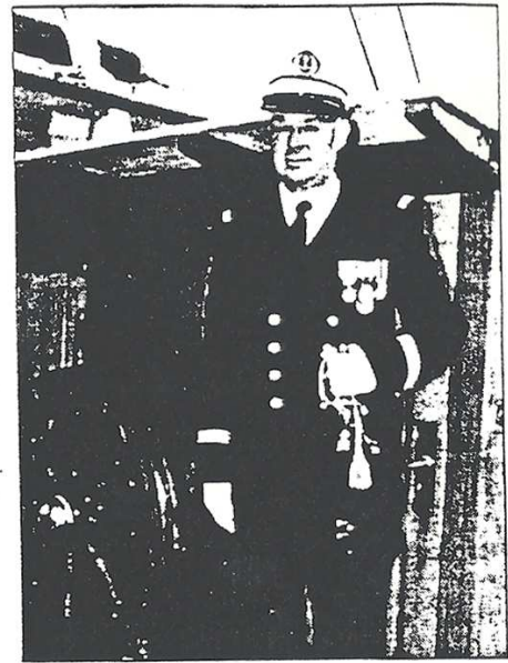
Le capitaine de vaisseau Michel Audren, commandant de l'« Étoile ».

mentation Thétis , puis de prendre la conduite du navire océanographique D'Entrecasteaux . Nommé lieutenant de vaisseau le 1 er août 1997, il est depuis le 1 er septembre commandant de l'« Étoile ».