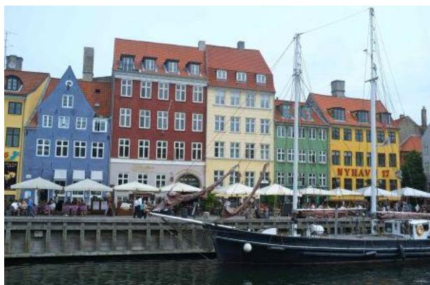
Le petit port de Nihavn avec en bleu la bâtisse la plus ancienne de la ville.