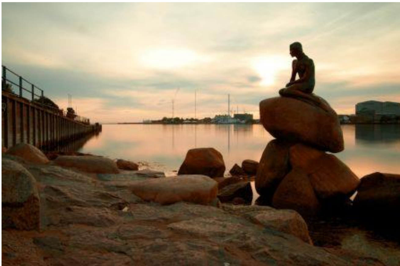
La Petite sirène par le sculpteur Edward Eriksen d'après le conte d'Andersen.