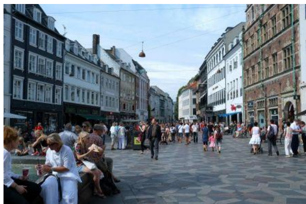
Le centre commerçant.