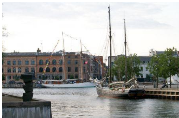
Autre vue de l'Etoile à quai.