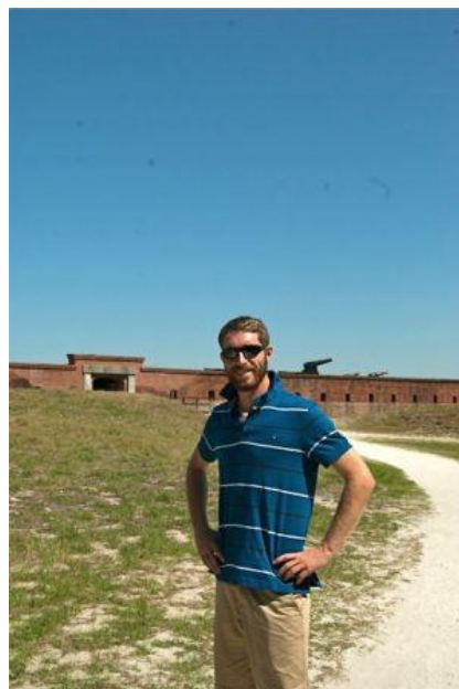
Arthur devant Fort Clinch

Déjà nostalgiques d'un tel accueil, les goélettes ont appareillé hier soir pour se diriger vers Jacksonville. Après quelques heures de chenalage pour remonter la rivière St John, escortées par des dauphins et salués par des coups de canon, l'Etoile et la Belle Poule ont accosté ce matin à Jacksonville, au pied de grands buildings typiquement américains. A peine la dernière aussière tournée, la fanfare de la Ribault School ainsi qu'une délégation locale ont accueilli nos équipages avec la Marseillaise.