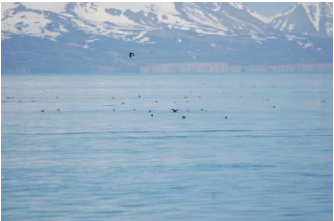
Non loin de la goélette, une nuée de macareux.

Enfin, nous profitons de cet article pour vous faire partager notre découverte de la matinée ainsi que notre mouillage de la nuit dernière. En effet aux alentours de 10h, nous sommes passés non loin d'une petite île où vivent une réserve de macareux. Les photographes sont allés de bon train pour immortaliser ce moment magique où la goélette traverse une nuée de petits oiseaux un peu boiteux mais si jolis à observer.