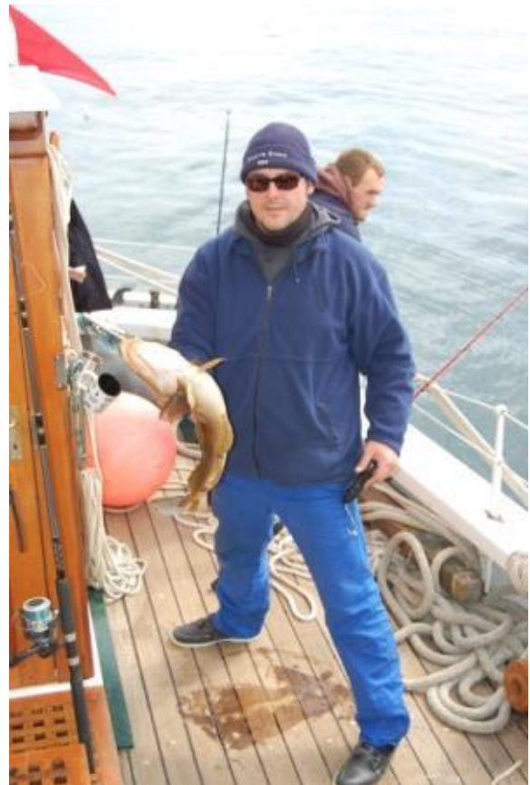
Premier poisson pêché par le chef mécanicien.