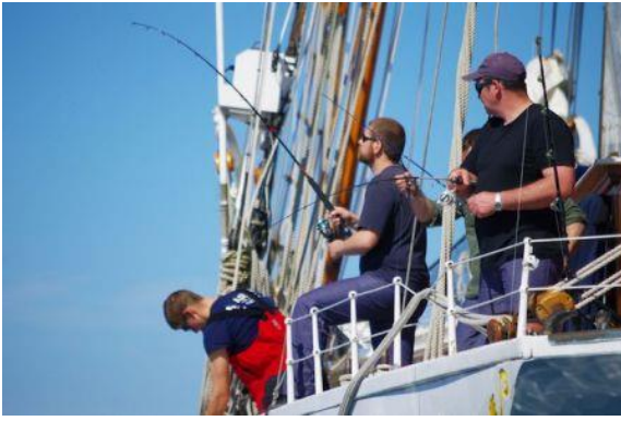
Mise à l'eau des premières lignes.