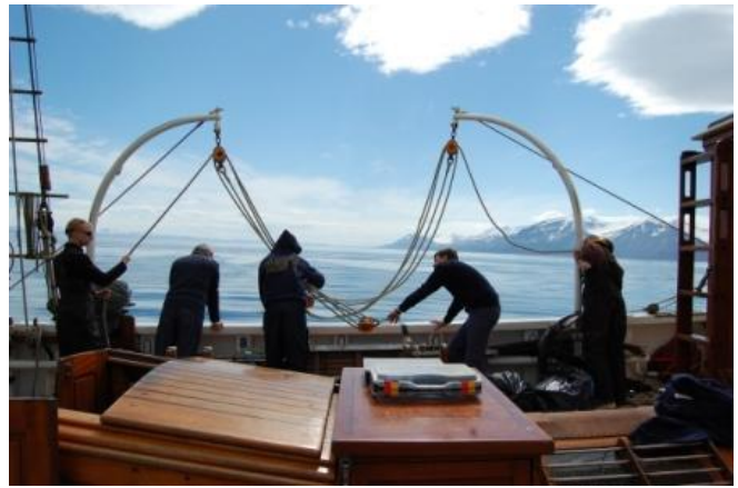
Vues de la goélette à la dérive

Mise à l'eau du zodiac.