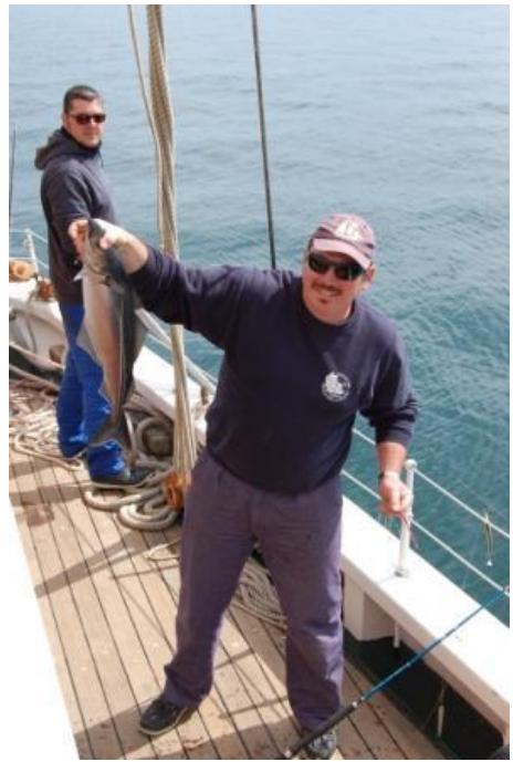
Poisson pêché par la Cuisse