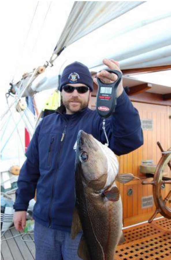
Poisson pêché par le Bosco.