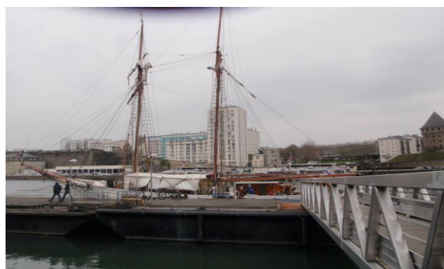
L'Etoile à quai en Penfeld

Entrée en indisponibilité pour entretien le lundi 18 mars, l'Etoile s'offre un coup de jeune avant d'entamer sa tournée d'été dans les hautes latitudes et sur les côtes française. Visites du matériel et entretiens des surfaces sont au programme. Chacun selon ses compétences et les organes dont il a la charge prépare au mieux le bateau pour les navigations à venir.