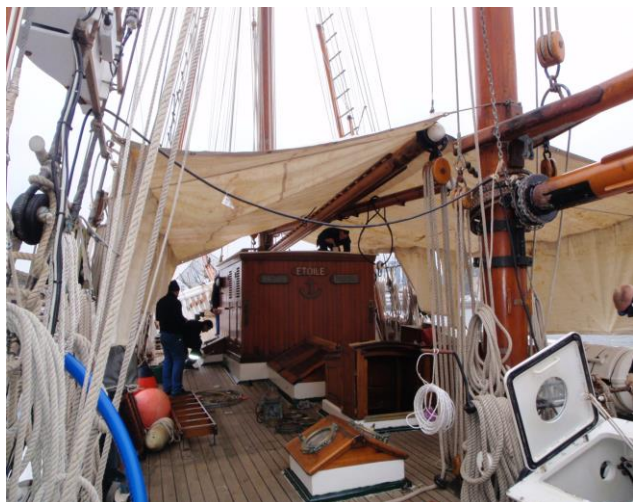
Chantiers divers sur le pont

Et, pour tous, l'entretien habituel, inhérent aux voiliers traditionnels : ponçage, vernis et peintures qui permettent de maintenir l'efficacité et l'esthétisme de la goëlette Etoile.