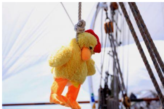
Idole pendue dans le cadre d'une prière à Neptune