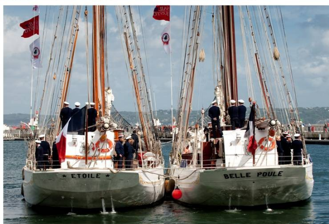
Août 2009, Retour à Brest de la Tall Ship Atlantic Challenge Accostage avec manœuvre à couple de l'Etoile et la Belle Poule

La manœuvre avec le Mutin nécessite de bien positionner son hélice à la hauteur de celle de la goélette. Son arrière sera dans le prolongement de la couronne de la goélette. Avec le Mutin, il est préférable que la goélette accoste tribord à quai. En effet, le Mutin ayant un pas d'hélice à gauche, une manœuvre à couple permet de bénéficier des avantages de deux lignes d'arbre avec des hélices supra-divergentes.